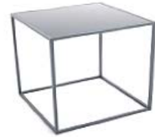
M175C | B37xT37xH37 Stahlplatte