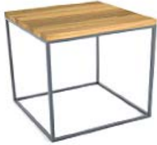
M175A | B37xT37xH39 E-Eiche, W-Walnuss, B-Buche, EG-Eiche gebeizt