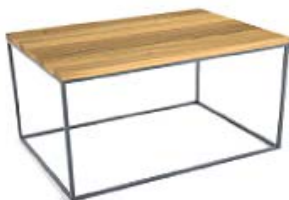
M178A | B67xT47xH39 E-Eiche, W-Walnuss, B-Buche, EG-Eiche gebeizt