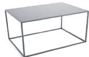
M178C | B67xT47xH37 Stahlplatte