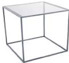
M177B | B47xT47xH49 Klarglas oder Graphitglas