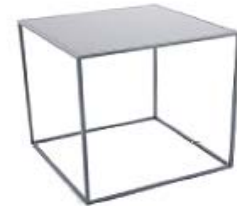
M177C | B47xT47xH49 Stahlplatte