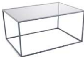
M178B | B67xT47xH37 Klarglas oder Graphitglas