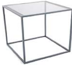
M175B | B37xT37xH37 Klarglas oder Graphitglas